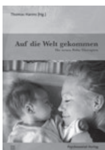
Thomas Harms: Auf die Welt gekommen Psychosozial-Verlag