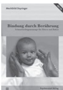
Mechthild Deyringer: Bindung durch Berührung Schmetterlingsmassage für Eltern und Babys Psychosozial-Verlag